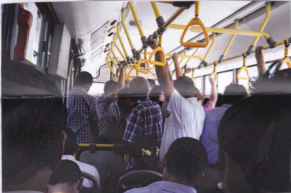
Interior del Metropolitano.